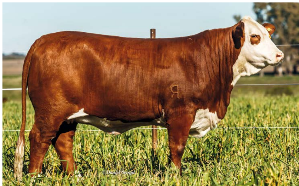
GUASUNCHOS 3125 EXPERTO