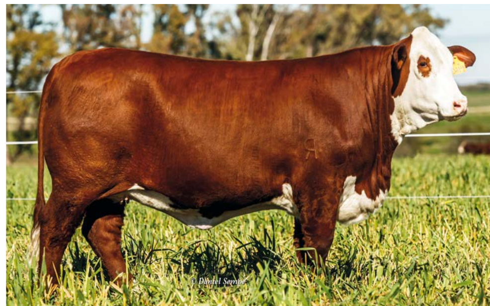
GUASUNCHOS 3125 EXPERTO