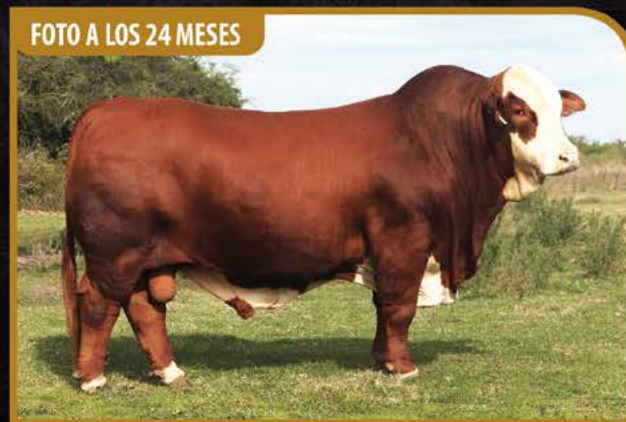
FOTO A LOS 24 MESES

Esto es lo que logro que hijas/os ganaran todo en la Nacional de Braford en Paraguay. Camiseta, volumen y musculatura. Ya un Clásico, imposible no usarlo.